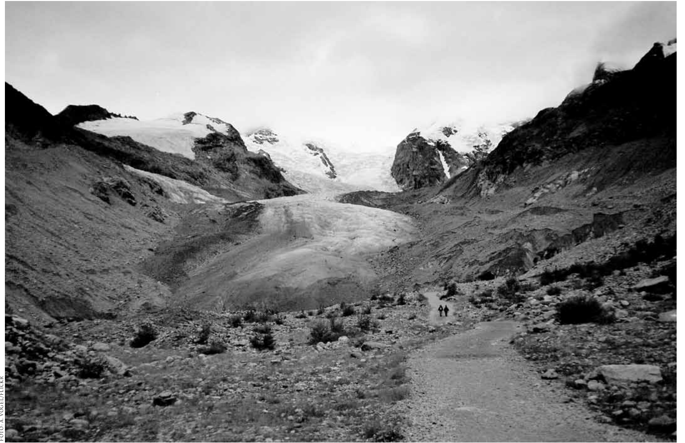
Das Heartland Institute würde wahrscheinlich stark bestreiten, dass es in dieser Steinlandschaft jemals einen Gletscher gegeben haben soll. Die verrückte Welt des »climatism« kommt halt schon mal auf schräge Gedanken.

Nun ist es so, dass die Rolle der Expert_innen, Intellektuellen und Akademiker_innen in der Analyse des US-Systems zumeist übersehen wird, aber bei genauerer Betrachtung sieht man sofort, wie eng Reichtum und Expertise in diesem oligarchischen System verflochten sind. Erstens sieht man den Einfluss der akademischen Eliteinstitutionen in den USA daran, dass hochrangige Universitätsadministratoren_innen in die Regierung mit eingebunden werden. Die beiden wohl bekanntesten Beispiele sind Larry Summers, der als Präsident der Harvard Universität die ökonomischen Dinge unter Clinton und Obama mitbestimmte, und Condoleezza Rice, die zunächst als eine der höchsten Verwaltungsangestellten der Stanford University und dann als Außenministerin in der George W. Bush Regierung die Strippen gezogen hat. Jetzt ist sie nicht nur wieder im akademischen Betrieb, sondern nimmt eine zentrale Beraterposition im konservativen Hoover Ins-